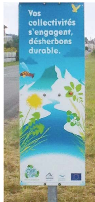
Panneau implanté à l'entrée du village

En outre, aide financière de 50 % a été accordée par l'Agence de l'Eau Adour Garonne pour l'acquisition de matériel de désherbage alternatif. Ainsi la commune s'est équipée d'une balayeuse dont le passage régulier élimine le substrat et les graines présentes dans les caniveaux.