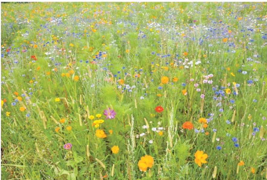
Jachère fleurie chemin de la Chataigneraie